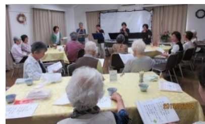
（ふれあい喫茶のようす 令和元年6月4日 2丁目自治会館にて）

尚、小学校の「森ふれあい喫茶」については学校の指導計画にのっとり開催予定です。今後、コロナの感染状況によっては変更もありえます。