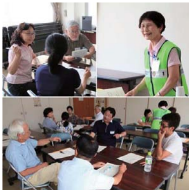
実際の災害を想定して・・・

阪神大震災に活躍した「災害ボランティア」は記録では140万人。実際にはそれ以上が関わったと言われています。つい2年前の東日本大震災でも、多くのボランティアが活躍しました。